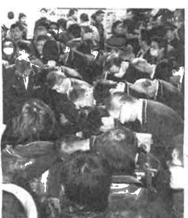
100周年の記念スイカの販売中止で購入できなかった客に謝罪する駅員ら(20日)

東日本旅客鉄道(JR東日本)は22日、客が殺到して途中で販売を中止した東京駅開業100周年記念のIC乗車券Suica(スイカ)について、増刷して希望者全員に販売すると発表した。時期や販売方法は未定としている。インターネットによる販売なども検討する。 赤れんが駅舎をデザインした記念スイカは20万5000枚の限定で発売。午前、東京駅丸の内南口で販売された。しかし購入希望者が殺到。JR東日本