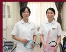
充実の24時間医療サポート