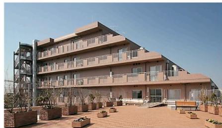
アクティビティの充実