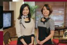
最上級のおもてなしを 心がけています