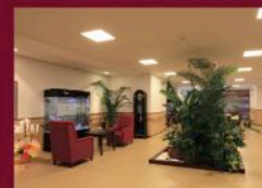
まるでホテルのようなエントランス