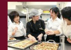
こだわりのおいしい食事