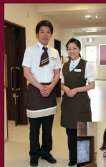
コンセプトは 「介護ホテル」